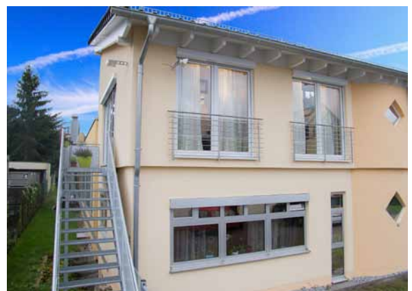
Aufstockung und Außentreppe machen aus einem Bungalow ein modernes Gebäude mit zwei separaten Wohneinheiten.

Lassen Baubehörde und Statik die Aufstockung um eine ganze Etage zu, gewinnen Sie weitere Gestaltungsmöglichkeiten. Sie können eine komplette eigene Wohnungseinheit schaffen und dabei durch eine überbaute Garage, ein angebautes Treppen-