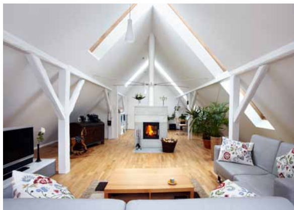
Überfirstverglasungen, sichtbar integrierte Dachstuhlstrukturen – faszinierende Gestaltungsmöglichkeiten im Dachausbau

Bauen ohne Bauland und ohne Stress – die Aufstockung schafft wertvollen Wohnraum mit vergleichsweise geringem Aufwand. Die Baumaßnahmen können meist ohne große Beeinträchtigungen am bewohnten Haus durchgeführt werden. Ihr DachKomplett-Betrieb unterstützt Sie bei der Einholung der Baugenehmigung und berät Sie, wie Sie die Möglichkeiten des für die Lage Ihrer Immobilie gültigen Bebauungsplans optimal nutzen – und dabei energetische Standards sowie technische Vorschriften zu Brandschutz, Blitzschutz, Schallschutz und Trittschalldämmung erfüllen.