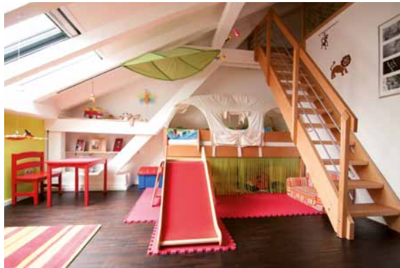
Unter Ihrem neuen Dach entsteht eine eigene Welt zum Spielen, Wohnen und Lernen.

Der ökologisch wertvolle Baustoff Holz bringt die besten Voraussetzungen zur Erfüllung statischer Bedingungen mit: hohe Festigkeit bei niedrigem Eigengewicht. Doch Aufstockung in Holzbauweise hat noch einen ganz anderen Vorteil. Ihr DachKomplett-Betrieb kann einen großen Teil der Arbeiten