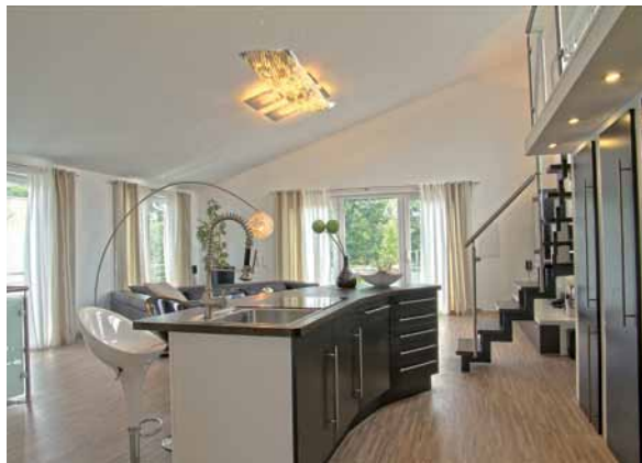
Bei der Modernisierung und Aufstockung von typischen Flachdachbungalows aus den 70er Jahren lassen sich bestens moderne Räume in klarer reduzierter Formensprache gestalten.

Sie haben das perfekte, großzügige Grundstück gefunden? Vielleicht mit altem Baumbestand und in einer gewachsenen Umgebung? Das darauf erbaute Wohngebäude aber ist in die Jahre gekommen. Oder stellt Sie ein ererbtes Elternhaus vor die Frage nach seiner zukünftigen Nutzung? Alte Grundstücke in interessanten Lagen sind selten unbebaut. Vorhandene Bauten abreißen und ein neues Gebäude errichten, ist ein weitverbreitetes Vorgehen. Doch Sie haben den Blick für ein schönes Ensemble? Sie wollen sich keine einfache Tabula-rasa-Lösung aufdrängen lassen? Es reizt Sie, einen ganz individuellen Weg zu gehen und dabei die vorgefundenen Gebäude energetisch zu sanieren und auf raffinierte Weise zu nutzen? Definieren Sie Räume neu und tun Sie es mit dem intelligenten Baustoff Holz. Ihr DachKomplett-Betrieb hilft Ihnen dabei.