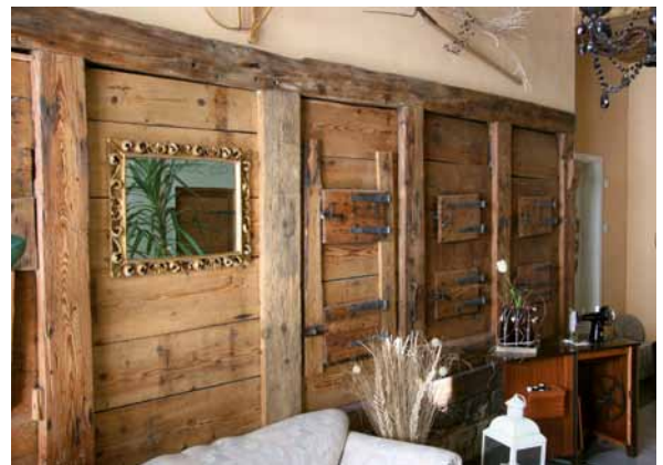
Durch raffinierte Instandsetzungs- und Umbaumaßnahmen entstehen aus alten sanierungsbedürftigen Bauernhäusern traumhafte Wohnlandschaften mit modernster Haustechnik.

Das Haus auf Ihrem Traumgrundstück hat eine besondere Ausstrahlung, seine alte Bausubstanz ist solide. Ob romantisches Landhaus, städtische Villa oder stylisches Architektenhaus – ganz gleich, was Sie in dem Gebäude sehen, bringen Sie es mit Ihrer Kreativität und der handwerklichen Erfahrung Ihres DachKomplett-Betriebs zum Leben. Das unkonventionelle Umdeuten ist der Schlüssel zur individuellen Nutzung vorhandener Bauten und Räume. Was Werkstatt, Scheune, Dachboden war, kann Wohnraum, Homeoffice, Wellness-Oase sein. Was Stall, Bootshaus, Darre war, wird Dojo, Meditationsraum, Atelier. Lassen Sie Ihrer Kreativität freien Raum, denn die Möglichkeiten, die Modernisierung, Neu- und Umbau mit Holz bieten, sind schier unbegrenzt.