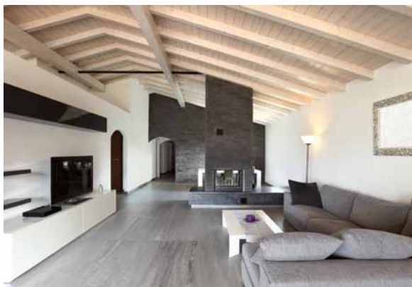
Stilsicherer Materialmix und Licht lassen aus ungenutztem Dachraum ästhetisch ansprechenden Wohnraum entstehen.

Nicht jedes alte Haus in gewachsener Umgebung hat den Charme und stilistischen Reiz, der seine Erhaltung nahelegt. Oft sind es auch praktische Erwägungen, die gegen Abriss und für Modernisierung sprechen. Ein alter Baumbestand oder schwierige Zufahrtsbedingungen – wo ein Neubau viel verwüsten würde, sind Umbau, Anbau und Ausbau mit Holz sehr viel schonender realisierbar. Und wenn das alte Haus zwar eine Bausubstanz hat, auf der man gut aufbauen kann, seine Ästhetik aber zu wünschen übrig lässt, kann die Neudefinition der Räume auch auf die Außenbereiche ausgedehnt werden. Wintergartenanbauten, innovative Dachkonstruktionen, moderne Fassaden – mit kreativen Ideen kann Ihr