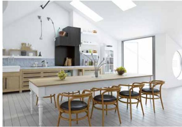
Offene großzügige Raumaufteilung, Dachschrägen und Galerien verleihen Gebäuden eine besondere Note.

Die energetische Sanierung bildet hier eine nachhaltige Maßnahme zur Werterhaltung von Wohngebäuden. Fachmännische Dämmung,