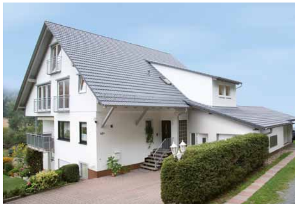
Energetische Sanierung mit Raumgewinn: Dachaufstockung, Anbau einer Doppelgarage und Teilnutzung der Fläche über der Garage

In Zeiten wirtschaftlicher Unsicherheit mit Banken- und Finanzkrisen stellt sich die Frage nach einer sicheren Geldanlage besonders dringlich. Anstatt auf der Jagd nach hohen Renditen vermeidbare Risiken einzugehen, wählen vorausschauende Menschen heute vermehrt wieder krisenfeste Anlageformen – auch mit Blick auf die eigene Altersvorsorge und Vermögenssicherung. Einer der besten Wege, um Werte zu sichern und zu mehren, ist die Investition in Immobilien. Dies meint nicht nur den Neubau, sondern verstärkt auch den Ausbau und die Modernisierung bestehender Wohngebäude.