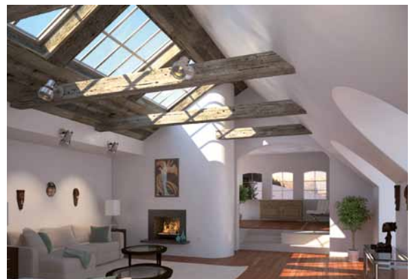
Im Dialog von Alt und Neu: Aus alten Bauernhäusern und Scheunen werden charmante Wohnlandschaften.

DachKomplett-Betriebe zeigen Ihnen gern, wie viel leichter Sie neue räumliche Gliederungen mit Holz verwirklichen können. Wände müssen nicht für die Ewigkeit gemauert sein, um stabil und schallgeschützt zu sein. Professioneller Holzbau eröffnet gestalterische Freiheit – für die Anpassung an Ihre eigenen Bedürfnisse oder für Anpassung an die Nachfrage eines anspruchsvollen Immobilienmarktes.