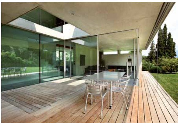
Im Dialog mit anderen Materialien wie Stein, Glas und Metall geht Holz gleichzeitig eine moderne wie natürliche Formensprache ein.

Gesundes Wohnen reicht jedoch weit über die Verwendung gesunder Baumaterialien hinaus. Ein wohngesundes Raumklima, in dem Oberflächen- und Lufttemperatur ebenso wie die Luftfeuchte optimal auf die spezifische Nutzung der Räume abgestimmt sind, das weitestgehend frei von gesundheitsbelastenden Stoffen wie Bakterien, Pilzen, Staub und Allergenen ist, bildet nur die Grundvoraussetzung. Sorgfältige Raumplanung, ein wirksamer Hitze- und Geräuschschutz, hohe Luftqualität, naturgemäße Licht-, Beleuchtungs- und Farbverhältnisse, ein neutraler oder angenehmer Geruch, niedrige CO 2 -Konzentration und nicht zuletzt die Ästhetik des Lebensraums spielen entscheidende Rollen für unser Wohlbefinden.