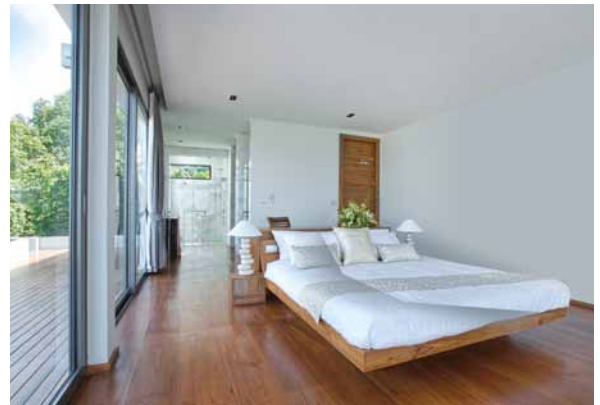
Der Schlafraum sollte gesund und natürlich gestaltet werden und die Psyche beruhigen. Elektromog und Wohnraumgifte gilt es zu reduzieren und die Schlafergonomie zu optimieren.

Steigende berufliche und gesellschaftliche Herausforderungen und die allgegenwärtige mediale Reizüberflutung fordern ihren gesundheitlichen Tribut. Besondere „Reinheits-Anforderungen“ gilt es daher an unsere Schlaf- und Ruheplätze zu stellen. Hier verbringen wir meist ein Drittel des Tages, um uns vom Alltagsstress zu erholen und neue Energie zu tanken. Schon kleinste Schlafstörungen können auf Dauer die lebensnotwendige Regenerierung von Psyche und Körper negativ beeinflussen und unseren Organismus destabilisieren.