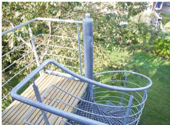
Separater Wohnbereich mit eigenem Zugang über Außentreppe – kreativer Holzbau macht's möglich.

Selbst wenn es der Platz zulässt, ist es selten eine gute Idee, wenn einfach ein Familienteil beim anderen einzieht. Ein Neubau oder eine wohldurchdachte Modernisierung sollte genutzt werden, um Lebensraum neu zu gestalten und aufzuteilen. Holzbau bietet dabei die größte Flexibilität, und ein erfahrener Fachbetrieb kann hier beraten und die vielfältigen Möglichkeiten aufzeigen.