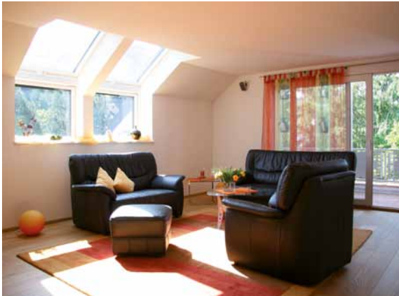
Licht und Dachterrassen schaffen auch unter Dachschrägen ein großzügiges Wohnambiente.

In einer Patchworkfamilie ist der Bedarf für eigene Sanitärbereiche besonders ausgeprägt. Stiefelerteile und die Kinder des Partners haben normalerweise nicht die Intimität der leiblichen Kindesbeziehung. Hier sollten DachKomplett-Betrieb und Baufamilie im Vorfeld besprechen, was geht und was nicht. Wo etwa anhand von Arbeitszeiten und Schulbeginn zeitlich gestaffelte morgendliche