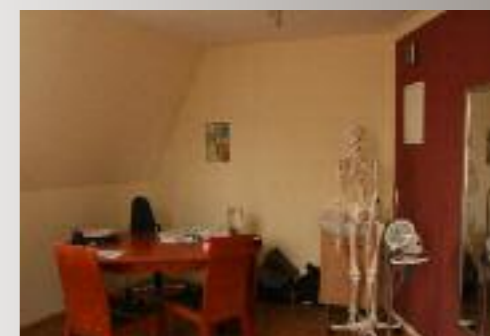
Die neuen Wohn- und Arbeitsräume sind hell und freundlich. Jetzt ist genug Platz für die Heilpraktiker-Praxis, aber auch für die beiden Teenager.