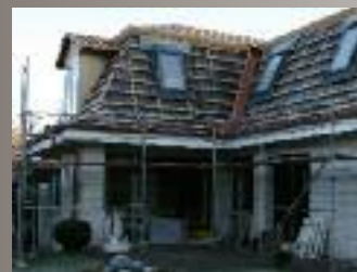
Nach kurzer Zeit war das Dach wieder mit der Eindeckung dicht.