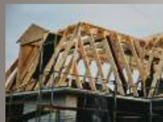
Zimmerer stockten den neuen Dachstuhl mit Gauben auf.