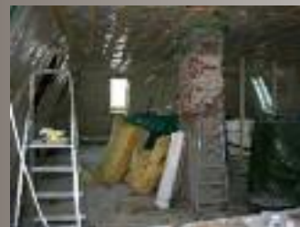
Auch der komplette Innenausbau ging zügig vonstatten.