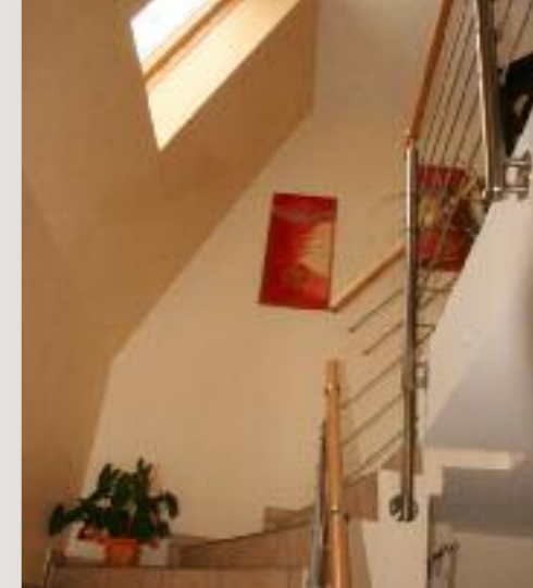
Auch der Eingangsbereich wurde modernisiert. Eine elegante Treppe führt nach oben in das neue Stockwerk.

FGZH mbH/QVDK Eisenacher Str. 17 80804 München Tel.: 0 89/3 60 85-140 Internet: www.dachkomplett.de