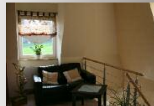
Die hübsche Galerie dient als Wartezone vor den Praxisräumen der Hausherrin.