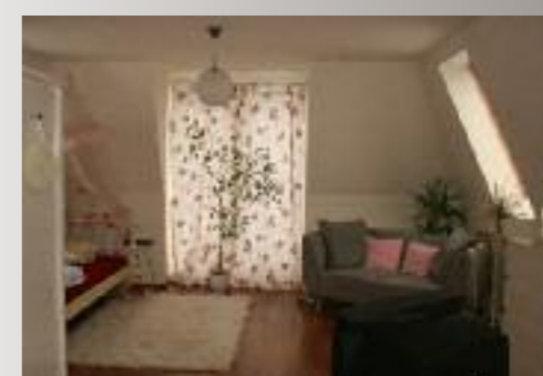
Durch das hohe Mansarddach ist der Platz in der neuen Etage optimal ausgenutzt, was den Bewohnern zugute kommt.